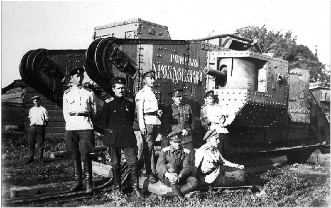
Команда танка «Генерал Дроздовский»