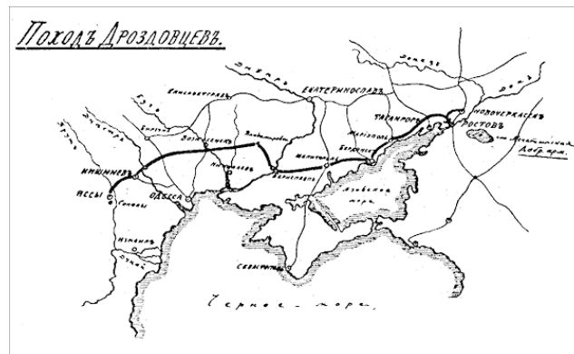
Поход дроздовцев. Рисунок А.И. Деникина