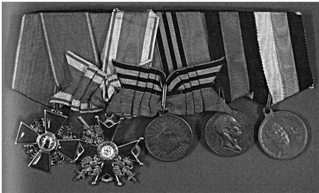
Награды М.Г. Дроздовского