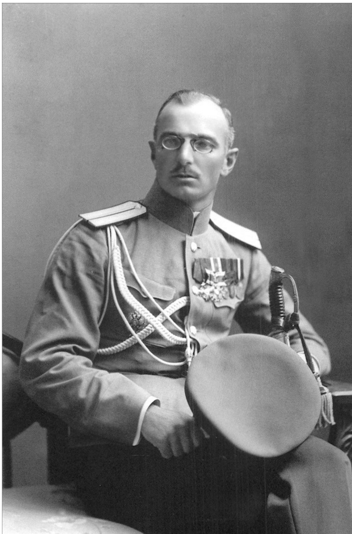
Генерального штаба капитан М.Г. Дроздовский