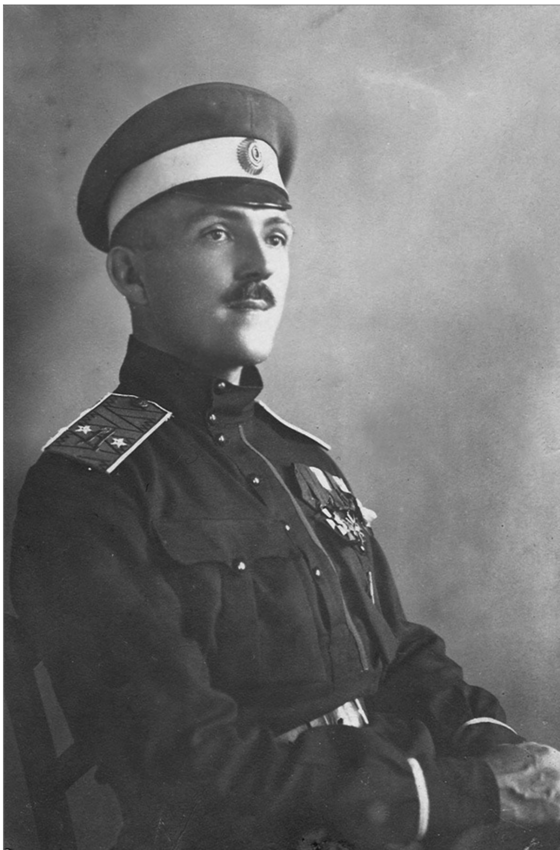
Генерал-майор А.В. Туркул