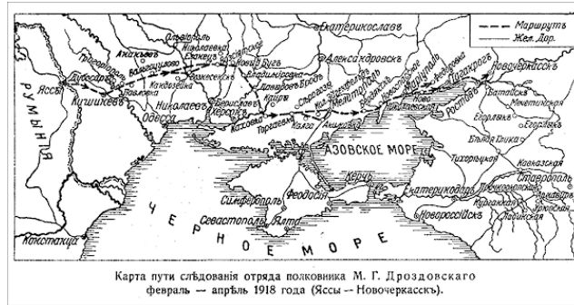
Карта Дроздовского похода