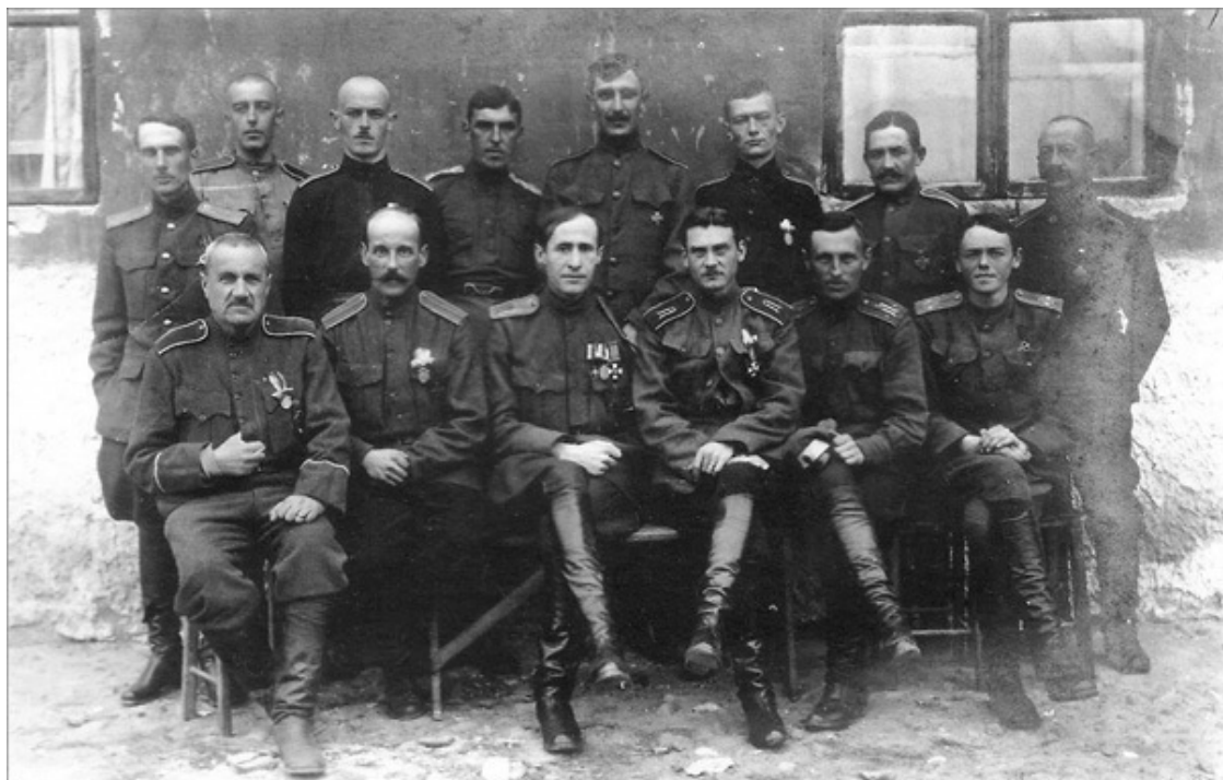
В.В. Манштейн (младший) с соратниками