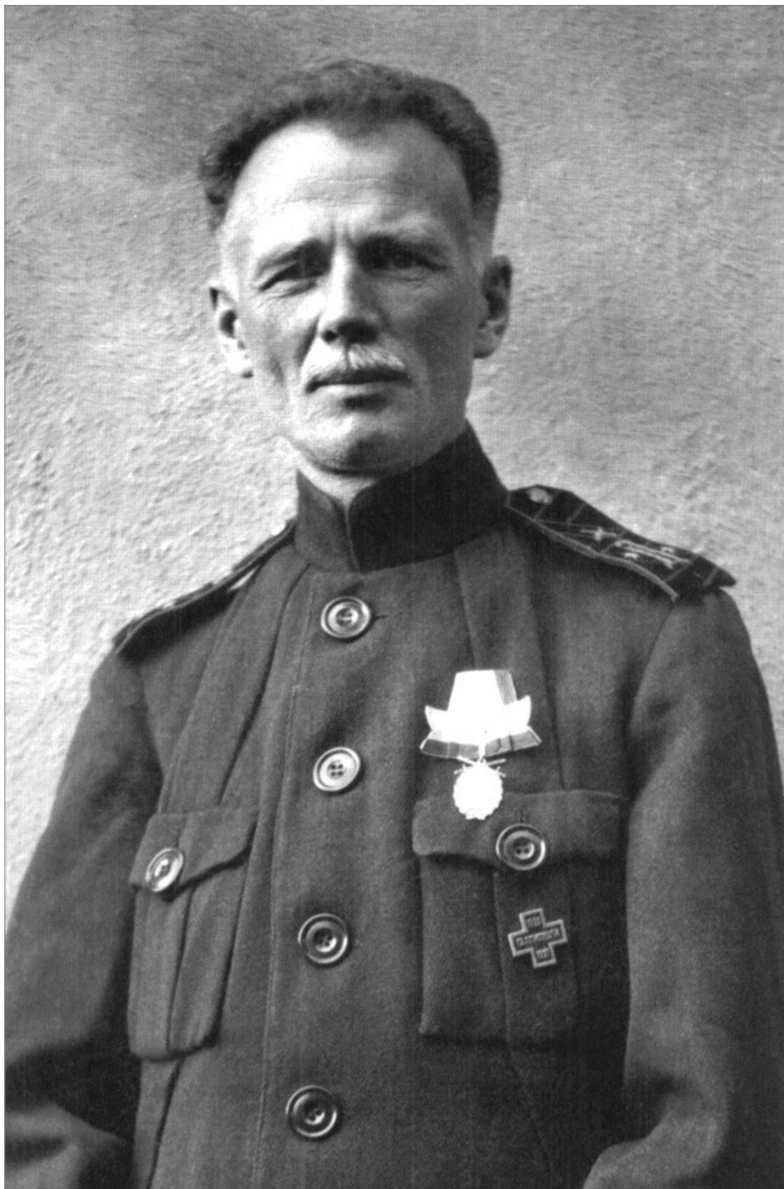
Генерал-мфйор М.Н. Ползиков