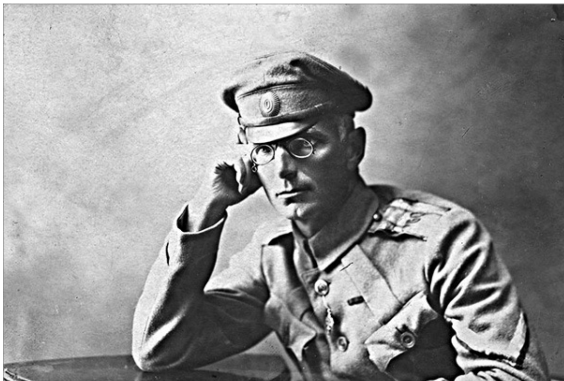
М.Г. Дроздовский. Фото разных лет