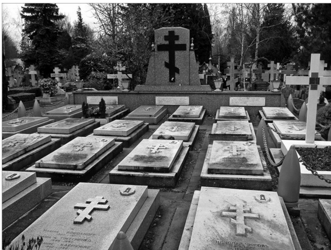
Памятник Дроздовскому и дроздовцам на кладбище Сен-Женевьев-де-Буа