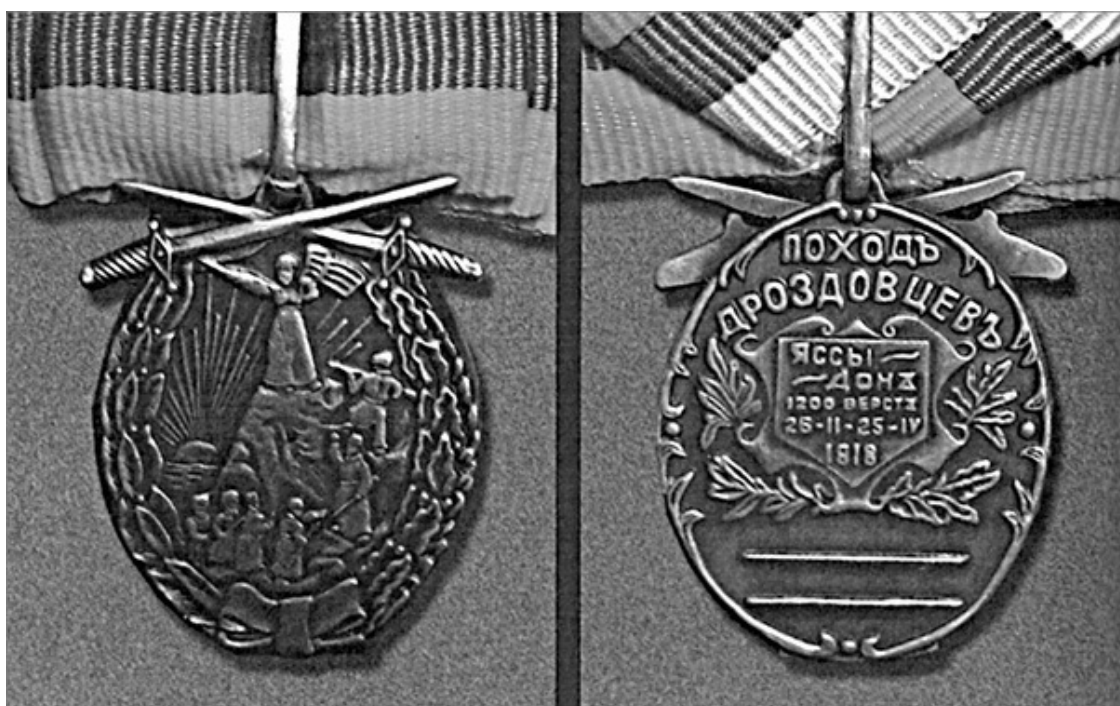
Памятная медаль участникам Дроздовского похода